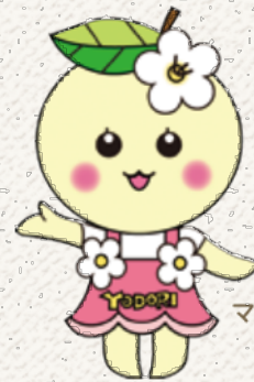
大淀町 マスコットキャラクター よどりちゃん