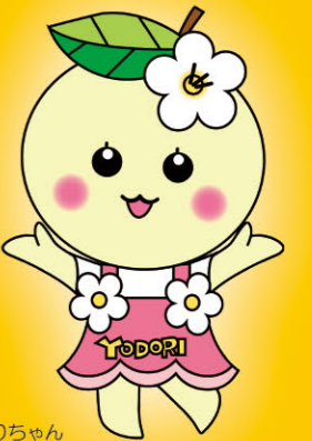
大淀町マスコットキャラクター よどりちゃん