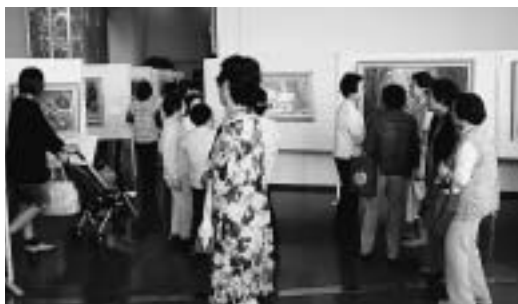
▲たくさんの方が会場を訪れました

4回目の開催となった今回の作品展には、約120点の力作が展示され、会場は終日たくさんの人で賑わいました。