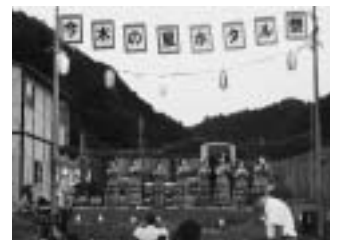
▲ステージではフラダンスなどが披露されました

特設ステージでは、ギター の 弾き語り、フラダンス、大正琴、和太鼓の演奏、南京玉すだれなどのアトラクションが披露されました。また、会場では金魚すくいやイカ焼き、うどん、串こんにやくなどの模擬店が出店され、たくさんの人で賑わいました。あたりが暗くなり、500器の燈火 の 明かりが幻想的に浮かびあがるころ、近くの小川では、ホテルが舞い始め、参加者はホテルの淡い光に酔いしれているようでした。