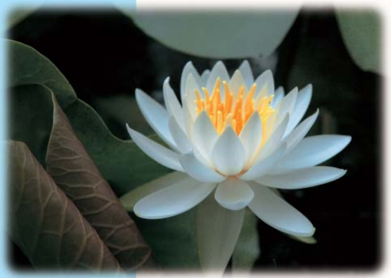
スイレン(東部幼稚園・中増)