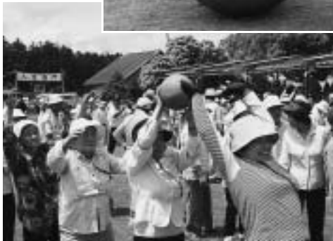
◀ちゃんと受け取ってね! ボールリレー