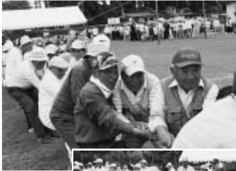
◀歯をくいしばって、力を合わせて綱引き

高齢者の健康増進と親睦 しんぼく を目的に行われたこの運動会には、町内から約600人が参加し、ボールリレーやデカパンリレー、玉ころがし、綱引きなどの競技が行われ、初夏の日差しのなか、参加者は楽しくさわやかな汗を流しました。