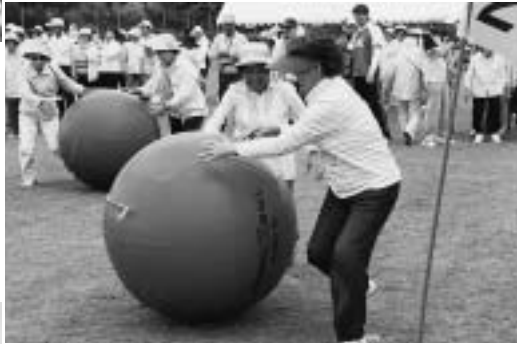
大玉さん ▶ どこいくの!