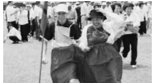
▲大きなパンツを二人ではいてデカパンリレー