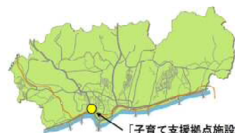
「子育て支援拠点施設」整備場所

小学校就学前のこどもとその保護者を対象にサークル活動や講演会、育児相談など、地域における子育て家庭の交流を促進するための地域子育て支援センターを整備します。