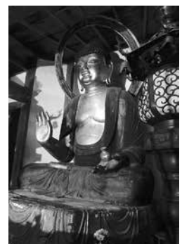
木造薬師如来坐像 (馬佐)