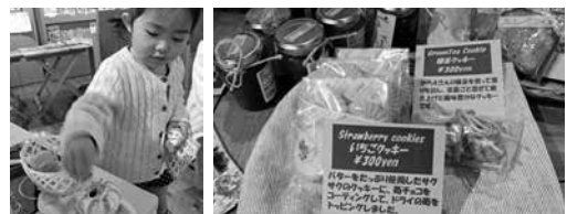
イベント会場の様子