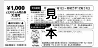
▲よどりちゃん商品券の見本