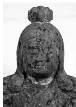
木造女神坐像 (大岩)

町指定文化財は、上記2件を含めて合計13件となりました。詳しくは町ホームページでご覧いただけます。