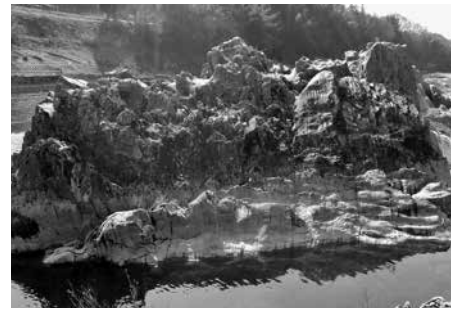
自然遺産「筆捨岩」(佐名伝)

2018年度おおよど遺産は、パンフレットでも紹介しています。パンフレットは、町文化会館の窓口などで配布しています。ただし部数が限られていますので、1人1冊限りで早めに問い合わせてください。なお、パンフレットは町ホームページからも無償でダウンロードできるので、活用してください。