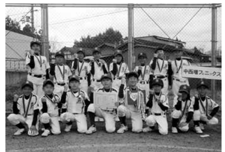
中西増スポーツ少年団の選手たち

優勝 中西増スポーツ少年団 準優勝 花吉野スポーツ少年団 第3位 桜ヶ丘 BB スポーツ少年団