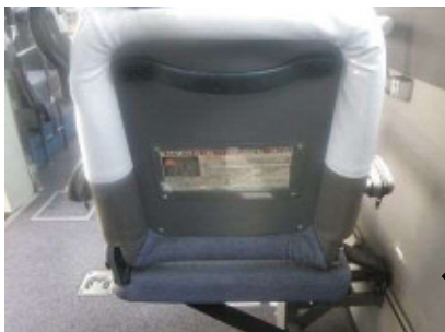
内部 座席裏面 85 × 200 × 2面 (1面につき4座席分)