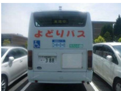
外部 車体後部 400 × 560