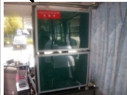
内部 運転席裏面 350 × 500 × 2面