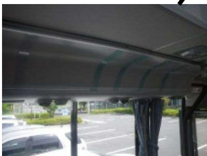
内部 左側上部 364 × 515 × 3枚