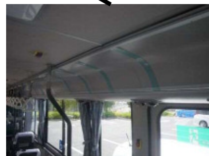
内部 右側上部 364 × 515 × 8枚