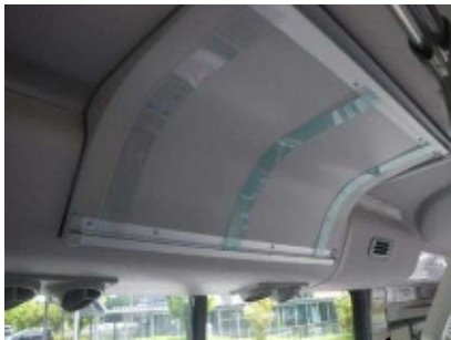
内部 左側上部 364 × 515 × 1枚