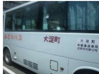
外部 右側側面 400 × 560 × 2枚